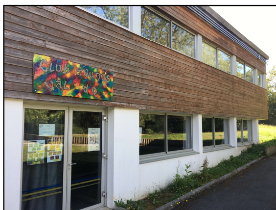
Accueil Evolus'Yon (10-13 ans) (Maison de Quartier du Val d'Ornay)

L'accueil de loisirs de l'Angelmière est organisé sous la responsabilité de l'Association des MA isons de Q uartier Y onnaises (AMAQY). Ce centre de loisirs accueille principalement les enfants des trois quartiers : Saint André d'Ornay, le Val d'Ornay et les Forges.